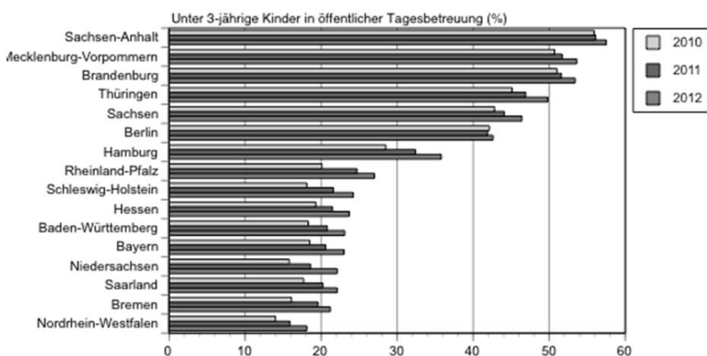
Abbildung 1: Ausbaustand der Kindertagesbetreuung für unter 3-Jährige